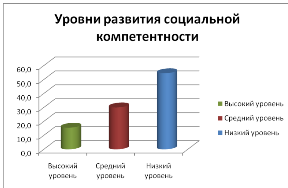
Диаграмма 3 - Уровень социальной адаптации выпускников

обучающихся, высокий уровень у 5% процентов, низкий уровень социальной компетентности у 40% обучаемых. Таким образом, данные результаты позволяют заключить, что механизм и организационно-педагогические условия программы развития направленные на формирование социальной адаптации обучающихся являются необходимыми